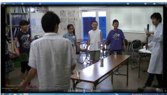
最後はみんなで輪になって・・・