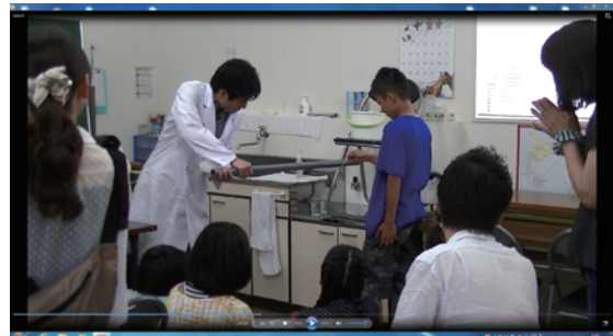
水の流りが曲がった！ 大拍手&歓声が上がります。