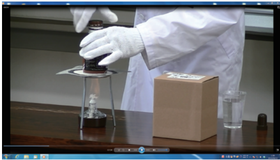
アルコールランプで加熱・・・ いったい何が起こるのか・・・！