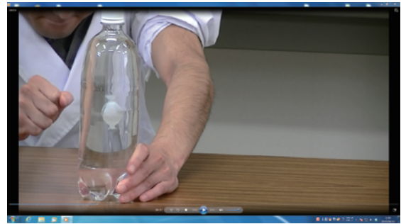
ハンドパワー！？ 浮沈子の実験です。