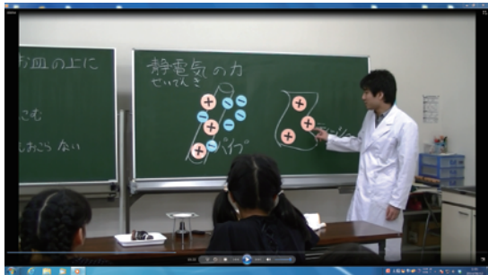
解説の時間です。 静電気のかとは・・・